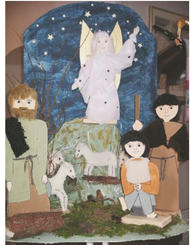
Der Engel verkündet: Fürchtet euch nicht!

Jubiläumskonzert Kinderbibeltage Naturstrom